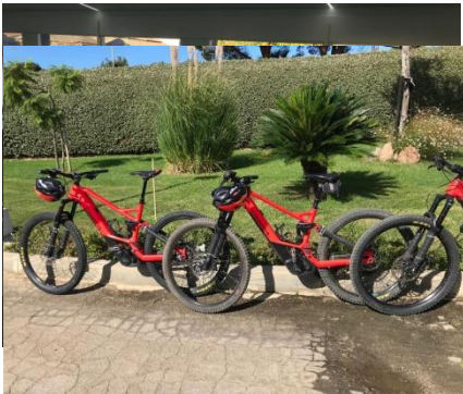
Salle de fitness