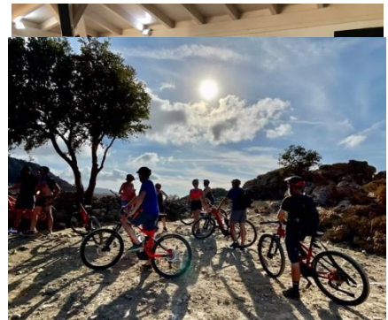
Boutique dans l'hôtel