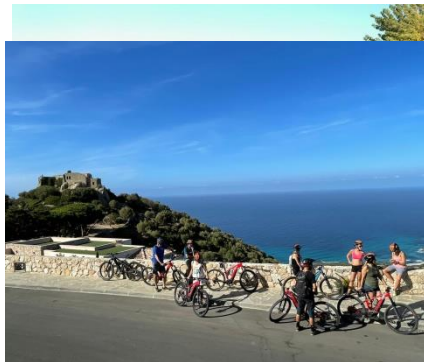
Parc de location de voiture